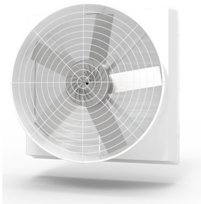
【AMA-5V-1460F】 五葉式鋁合金扇葉