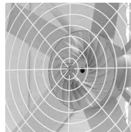
PMSM 外轉永磁同步馬達