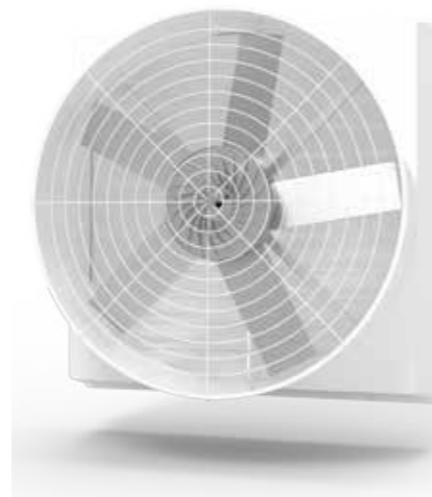
【AMA-5V-1460F】 五葉式鋁合金扇葉